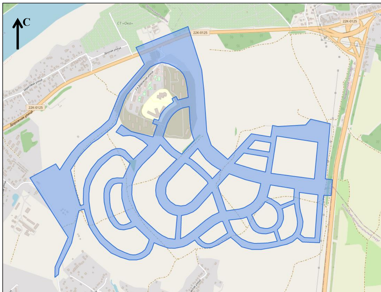
Схема границ подготовки документации по планировке территории (арх. № 51/23)

«ПРИЛОЖЕНИЕ к приказу министерства градостроительной деятельности и развития агломераций Нижегородской области от 10 ноября 2022 г. № 06-01-02/70